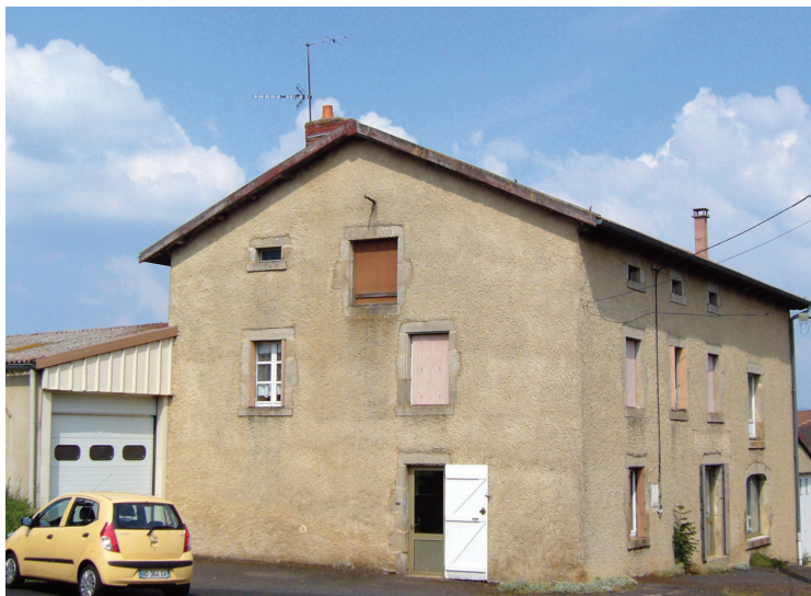
Ancien bâtiment de la boulangerie Mazoyer