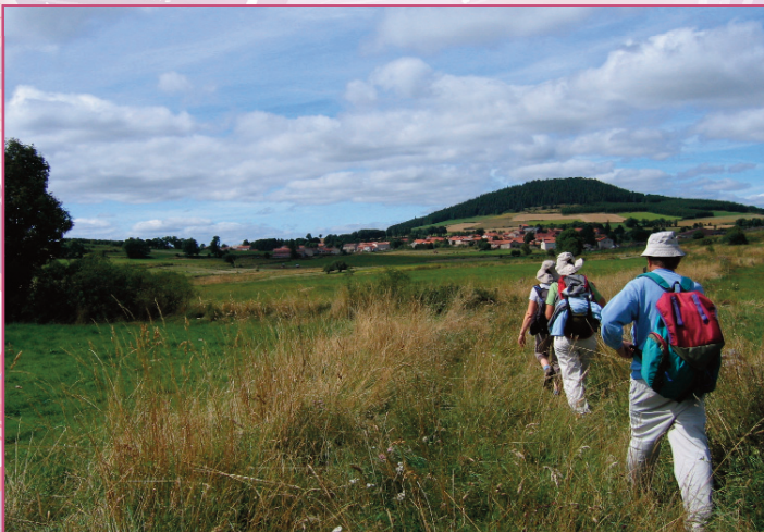
Saint-Paul-de-Tartas (altitude 1 206 mètres) : circuit pédestre à l'entrée du bourg

Arlempdes Barges Costaros Coucouron Lafarre Lanarce Landos Langogne Le Bouchet St-Nicolas Le Brignon Lesperon Pradelles Rauret St-Alban-en-Montagne St-Arcons-de-Barges St-Etienne-du-Vigan St-Haon St-Paul-de-Tartas Vielprat