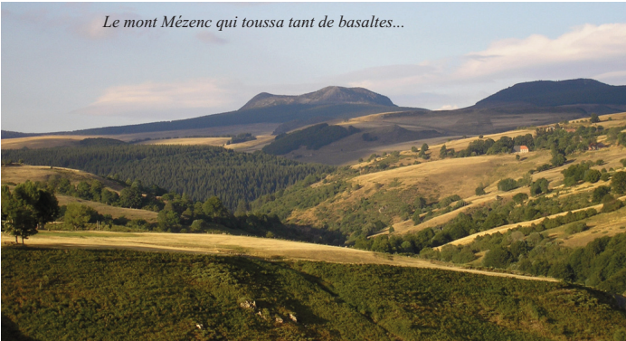
Le mont Mézenc qui toussa tant de basaltes...

«La principale cime de cette chaîne volcanique, d'où se prolonge vers le nord-est la rangée des Boutières, faite de partage entre la vallée du Rhône et celle de la Loire, est le Mézenc lui-même, dont les trois dents s'élèvent au-dessus des pâturages en pente douce, tout diaprés de fleurs» : Élisée Reclus