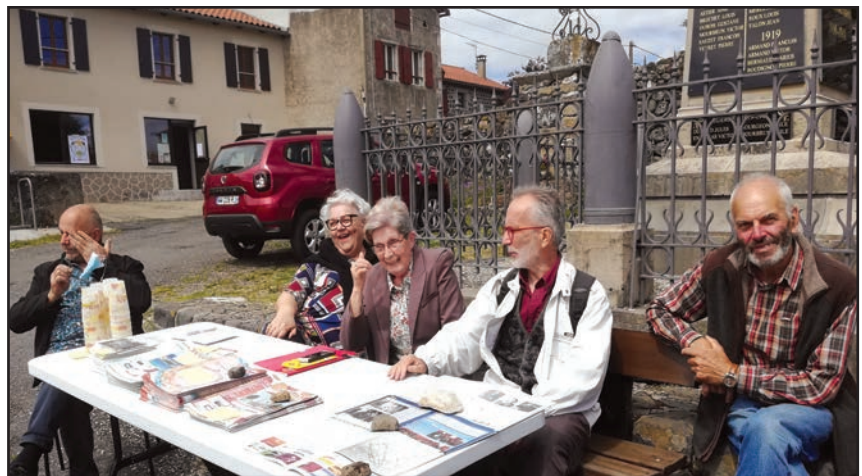
Notre participation à la vogue de St-Paul-de-Tartas, le 4 juillet