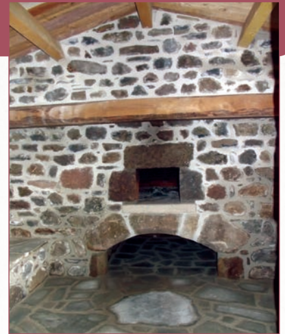
Lieu convivial et chaleureux pour les habitants des Souils d'Arlempdes

La température de la première chauffe ne doit pas être trop élevée, environ 100°C, afin de permettre une évaporation douce de l'humidité emprisonnée. La durée est d'environ 1h. Il est préférable de répéter cette