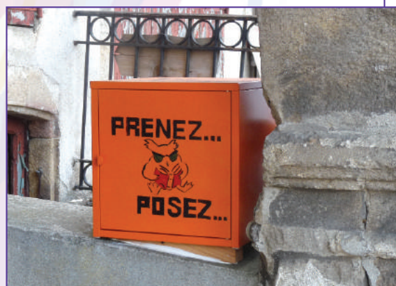
L'une des boîtes à livres à Pradelles