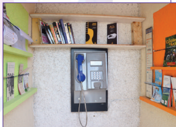
Cabine téléphonique à Vielprat