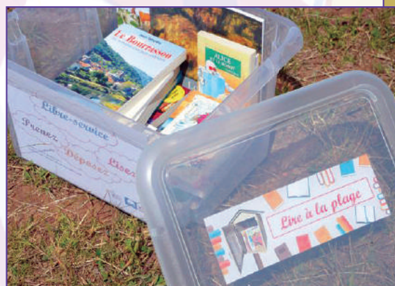
Malle à livres au lac du Bouchet

Si vous aussi dans votre village une boîte à livres a fait son apparition, envoyez-nous en la photo !