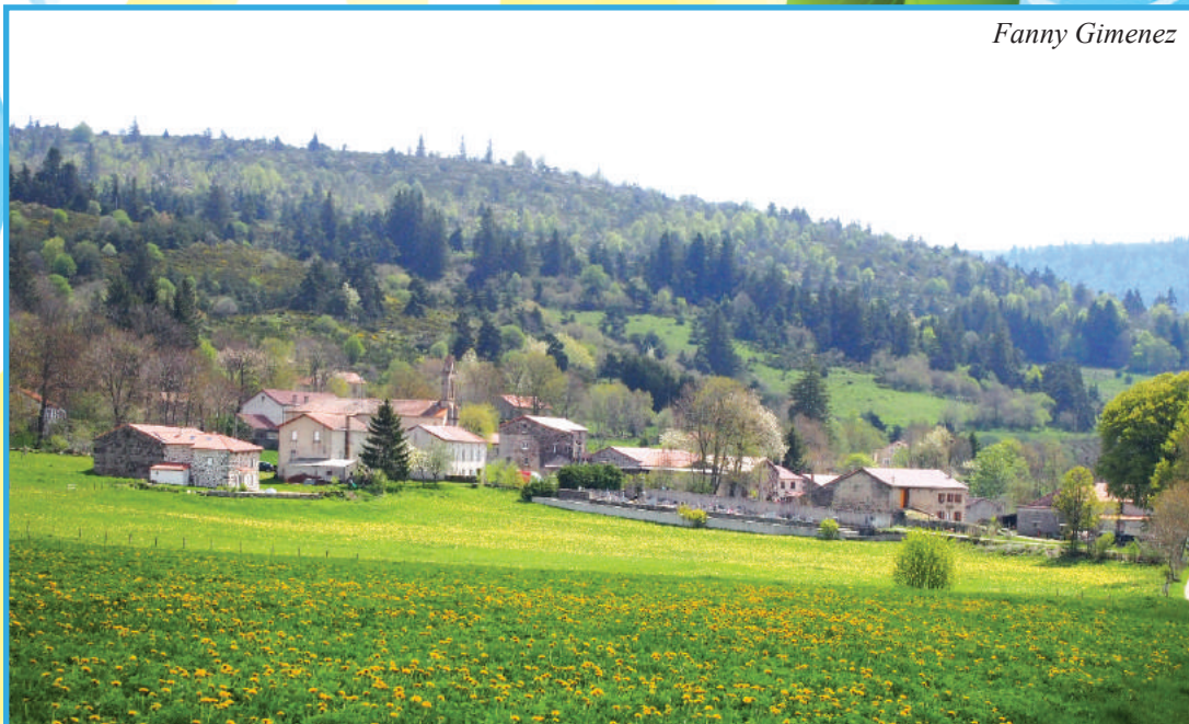
Le Plagnal (Ardèche, Alt. 1160m)

Page 7 : présentation de la commune du Plagnal