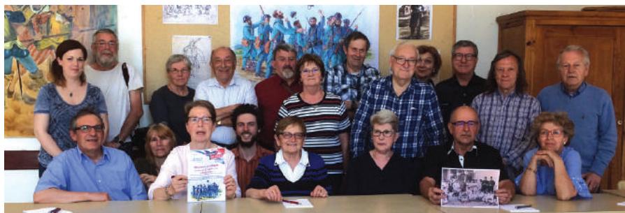
Lors de la réunion publique du 21 avril

originales, non signées, et réalisées sur place dans un lieu librement accessible au public, pendant notre événement. Une seule participation par personne est acceptée.